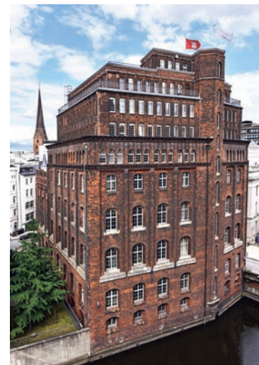
Das Haus der Patriotischen Gesellschaft

sie die Pandemie eine größere Rolle wegen der Defizite bei der Digitalisierung. Abgesehen davon habe Deutschland mehr Migranten aufgenommen als vergleichbare Länder.