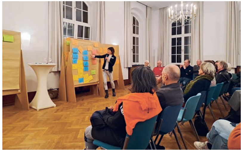
Sieben neue Themengruppen