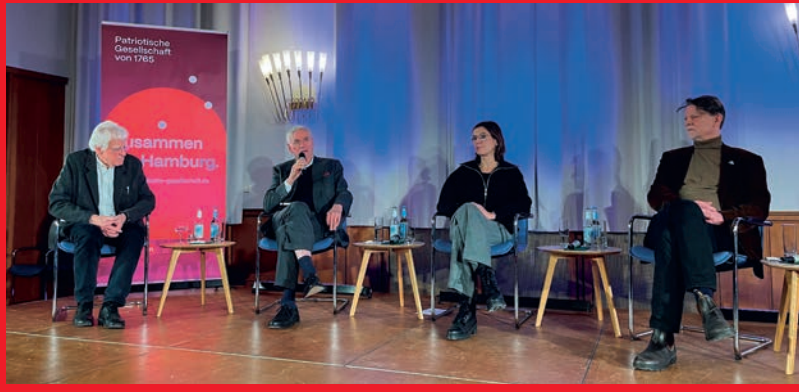
Reederstrategie hat Hamburg nur noch die Rolle eines Regionalhafens.

Hapag-Lloyd, die Reederei, bei der Hamburg „Ankeraktionär“ ist, hat sich nun ohne Hamburg am JadeWeserPort Wilhelmshaven beteiligt und ist mit Maersk eine Schiffsflottenallianz eingegangen, die mit ihren großen Überseeschiffen den Hafen Hamburg nicht mehr anfahren wird. Nach dieser neuen