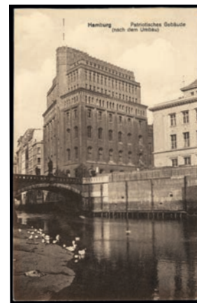
Das Haus der Patriotischen Gesellschaft. Historische Postkarte