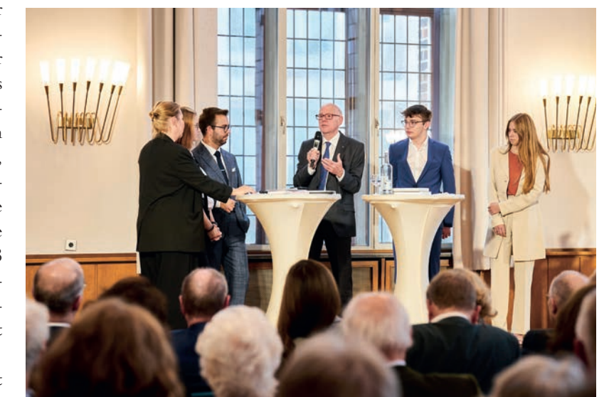
Prof. Dr. Norbert Lammert diskutiert mit Teilnehmerinnen und Teilnehmern der Jugendprojekte

kann, und stellen im „Young Future Lab“ die junge Generation und ihren Blick auf die Zukunft in den Mittelpunkt. Die Patriotische Gesellschaft ist als Beiratsmitglied im Initiativkreis Hamburger Stiftungen an der Vorbereitung der Hamburger Stiftungstage beteiligt. ✂