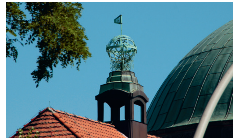
Symbol der universalen Bedeutung von Wissenschaft: die Armillarsphäre auf dem Hauptgebäude der Universität Hamburg

Hamburg soll zur Wissenschaftsmetropole werden, die das Potenzial der norddeutschen Länder bündelt. Der Forschungscampus Bahrenfeld der Universität Hamburg und des DESY soll sich neben Berlin-Adlershof und München-Garching zu einem der führenden Forschungsstandorte Deutschlands entwickeln. Und die Universität Hamburg soll sich im Rahmen der Exzellenzstrategie des Bundes und der Länder als eine der strategisch geförderten Exzellenzuniversitäten profilieren.